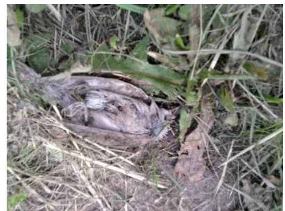
Kapturka Sylvia atricapilla