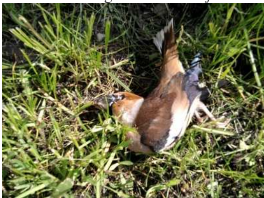
Grubodziób Coccothraustes coccothraustes