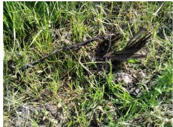
Kos Turdus merula