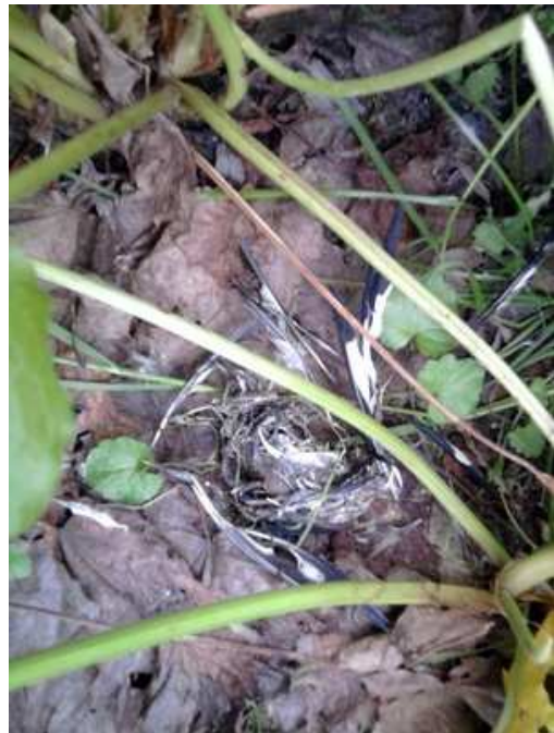
Grubodziób Coccothraustes coccothraustes