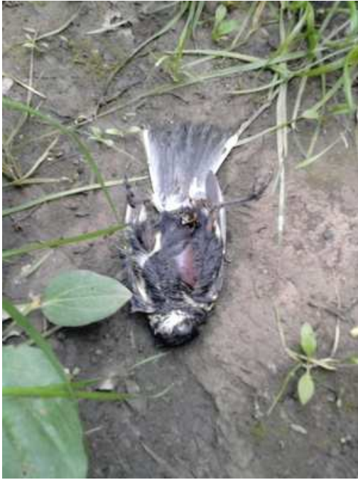
Sikora bogatka Parus major