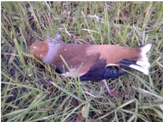
Grubodziób Coccothraustes coccothraustes