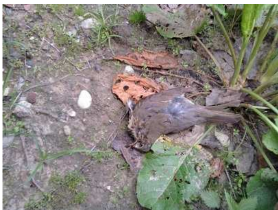
Śpiewak Turdus philomelos