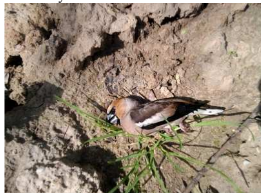
Grubodziób Coccothraustes coccothraustes