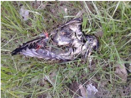
Dzieciół duży Dendrocopos major