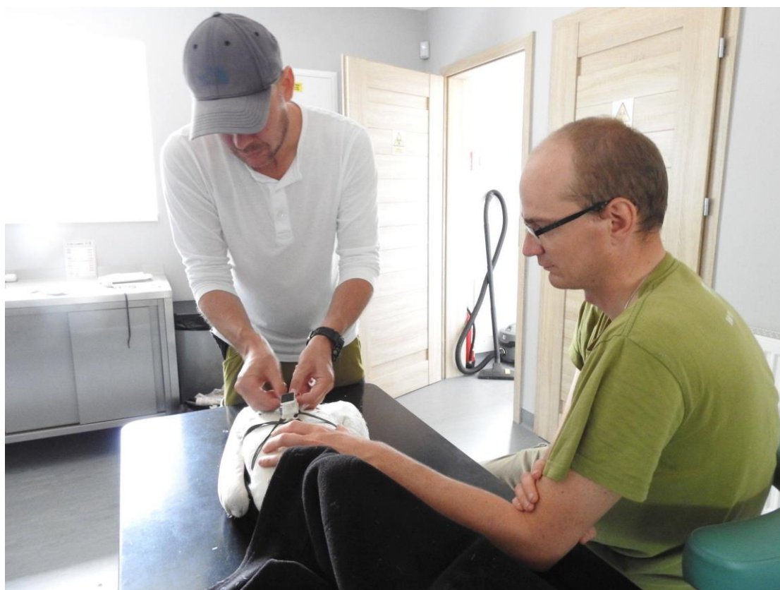
Fot. 1. Zakładanie nadajnika.

W 2019 r. do monitoringu bocianów wykorzystano 3 nadajniki zakupione w poprzednim roku. Nadajniki założono w sumie na 4 bociany. Wiosną 2019 r. oznakowano jednego z kilku ptaków wypuszczanych po przezimowaniu. Niestety, oznakowany bocian okazał się niesprawny i pozostał w ośrodku. Nadajnik zdjęto i latem wykorzystano ponownie na innym