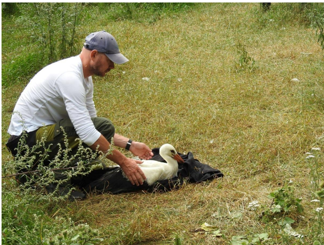
Fot. 2. Wypuszczanie do woliery bociana po założeniu nadajnika